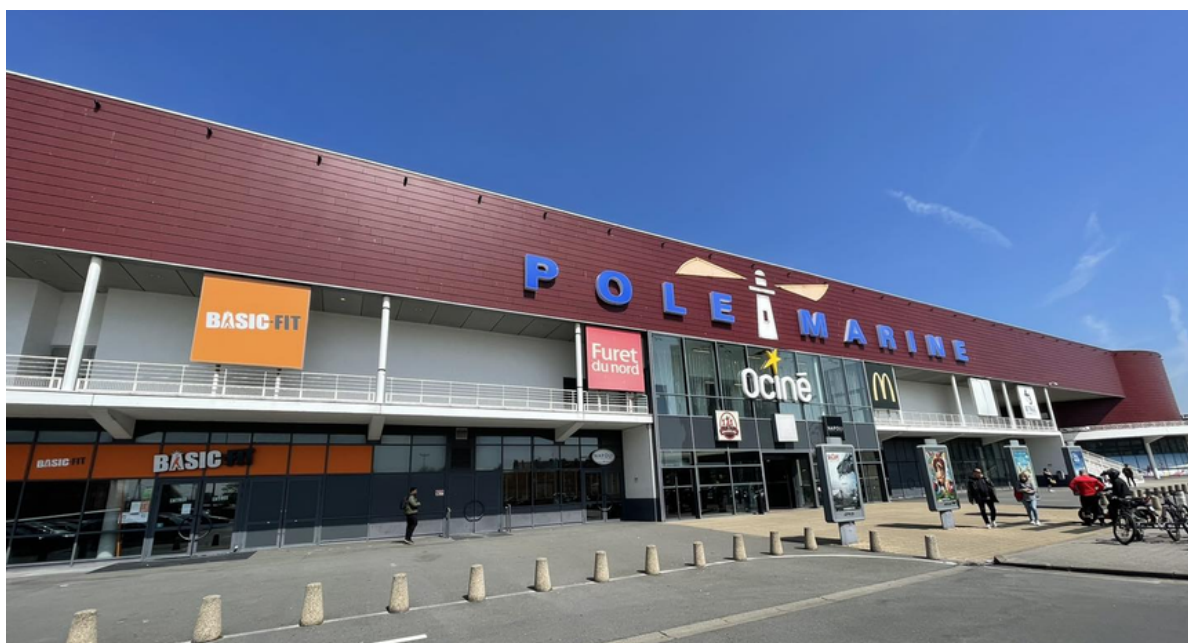
POLE MARINE DUNKERQUE

Fort des activités qu'il propose et du passage régulier du grand public dans son infrastructure, le Pôle Marine accueillera une exposition d'une douzaine de panneaux sur le thème du nucléaire. Cette exposition a été réalisée par l'Autorité de Sûreté Nucléaire (ASN) et l'Institut de Radioprotection et de Sûreté Nucléaire (IRSN) et sera installée du 7 au 17 octobre 2023.